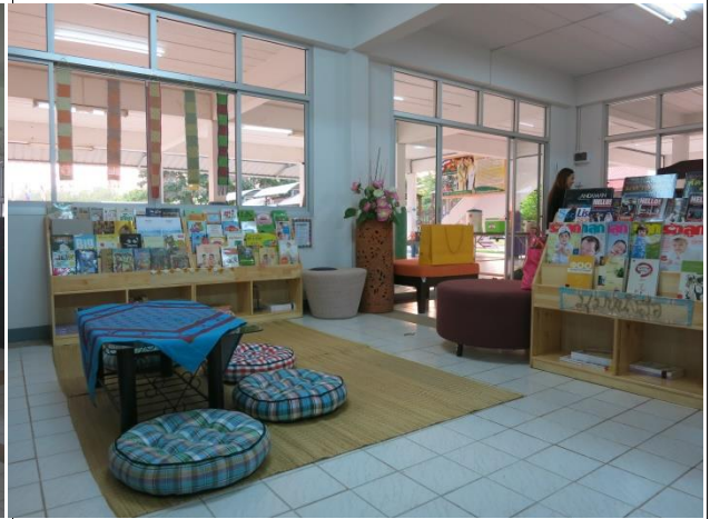
หลัง สร้างเป็นมุมตู้ปกกรอง