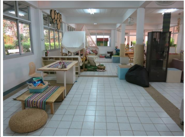
หลัง สร้างเป็นมุมบรรณารักษ์