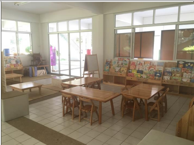
หลัง สร้างเป็นมุมอ่านหนังสือของเด็ก