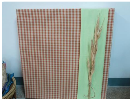
บอร์ดข่าวสารทำจากฟางข้าวที่มาจากการจัดสวนโดย ชาวบ้าน สะท้อนเกษตรกรรมของพื้นที่