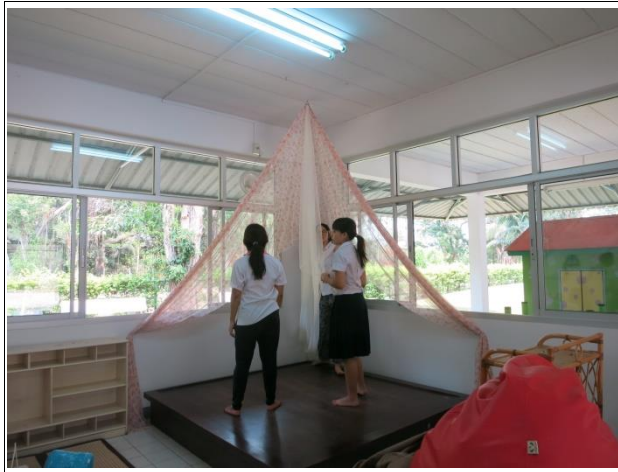
ตกแต่งตั้งที่มีอยู่เดิมให้มีบรรยากาศน่าอ่าน