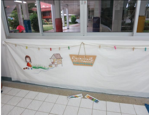
มุมมองภาพสะท้อนการเรียนรู้บนผนัง