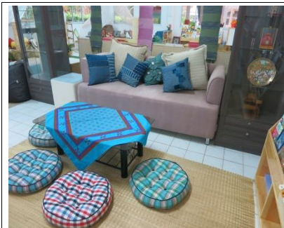
สืบสานงานของสมเด็จพระนางเจ้าฯ ด้วยผลงาน หัตถกรรม เช่น เบาะและผ้าปูจากศูนย์ศิลปาชีพ บางไทร