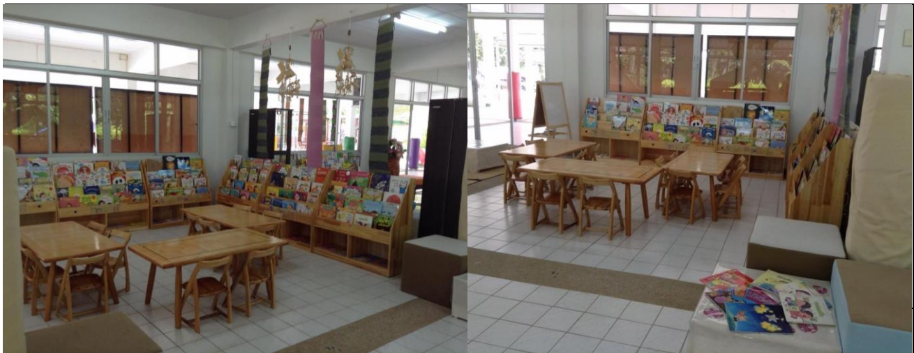
white board และเป็นซอหลัก

1) ที่สำหรับฝึกหัดนั่งอ่านหนังสือที่โต๊ะ จะมีลักษณะการนั่งอ่านกับโต๊ะใกล้ชั้นหนังสือที่ได้มีการจัดหมวดหมู่หนังสือตามประเภทของหนังสือเด็กตามโค้ดสี