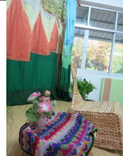
ตกแต่งห้องด้วยดอกบัว