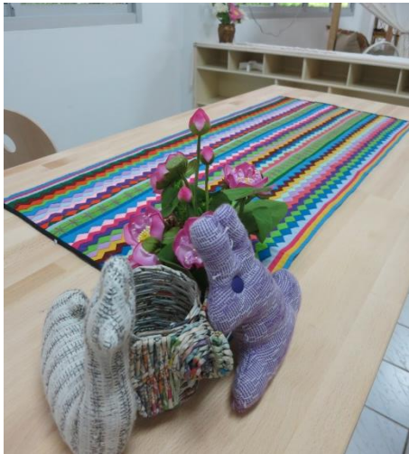
ตกแต่งโต๊ะบรรณารักษ์ด้วยผ้าพื้นเมือง