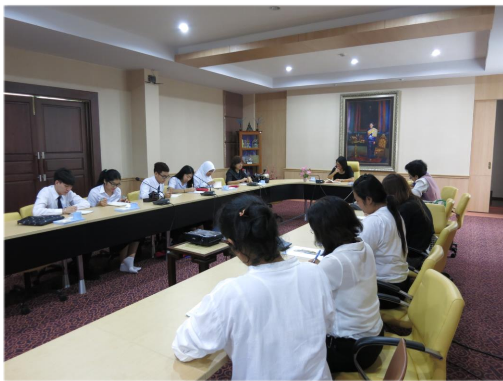
ภาพบรรยากาศการประชุมเตรียมงานการจัดห้องสมุดระหว่างคณาจารย์และนิสิตสาขาวิชาการศึกษาศึกษาปฐมวัยและคณะครู โรงเรียนศูนย์ศิลปาชีพฯ

การดำเนินการในแต่ละช่วงมีรายละเอียดดังนี้