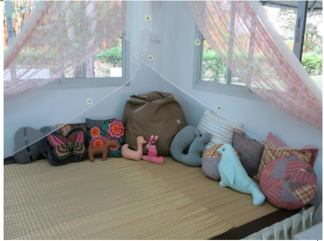
จัดวางหมอนให้น่านั่ง โดยเป็นหมอนจากโครงการคอตุงที่ทำจากงานหัตถกรรมผ้าไทย