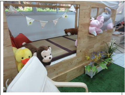
หมอนตุ๊กตาสะท้อนสัตว์พื้นบ้าน

ภาคผนวก ข เปรียบเทียบผลการจัดห้องสมุด ก่อนและหลังจัด