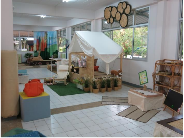
หลัง ที่อ่านหนังสือร่วมกับเพื่อน