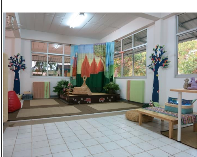
เวทีเล่นทานให้กับเด็ก