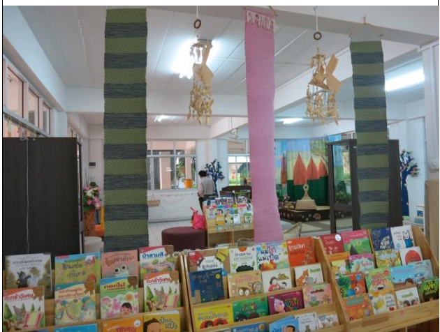
ห้อยปลาตะเพียนสัญลักษณ์ของอุรุษยา