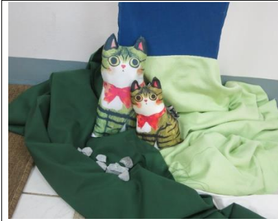
ตกแต่งโคมต้นไม้ด้วยแมวที่รักษาค้นไม้