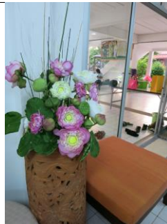
ดอกบัวจากสายใจไทย