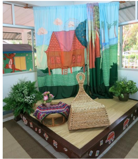
เก้าอี้สำหรับให้ครูเล่นทานให้เด็กฟัง

1.3 ที่สำหรับฝึกดูแลหนังสือร่วมกับครูบรรณารักษ์ คือ มุมที่เด็กได้มาฝึกการดูแลหนังสือร่วมกับครูบรรณารักษ์ เช่น การซ่อมแซมหนังสือ การแยกประเภทหนังสือยืมคืนเพื่อคืนเข้าชั้น