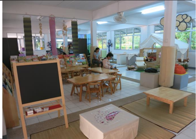
มุมมองภาพสะท้อนการเรียนรู้บนกระดาน