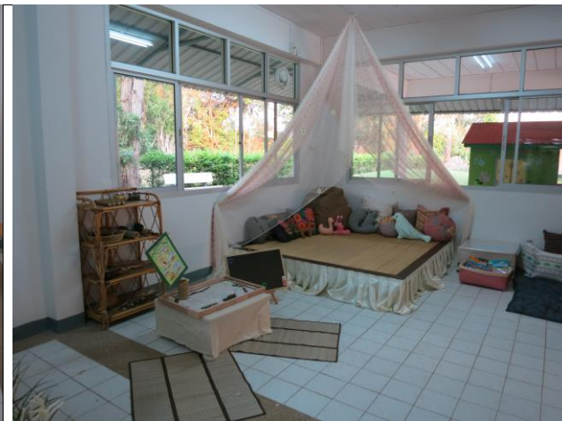
หลัง สร้างเป็นที่นั่งอ่านหนังสือ