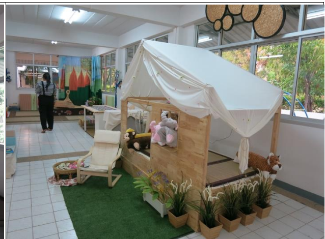
หลัง สร้างเป็นบ้านอ่านหนังสือ