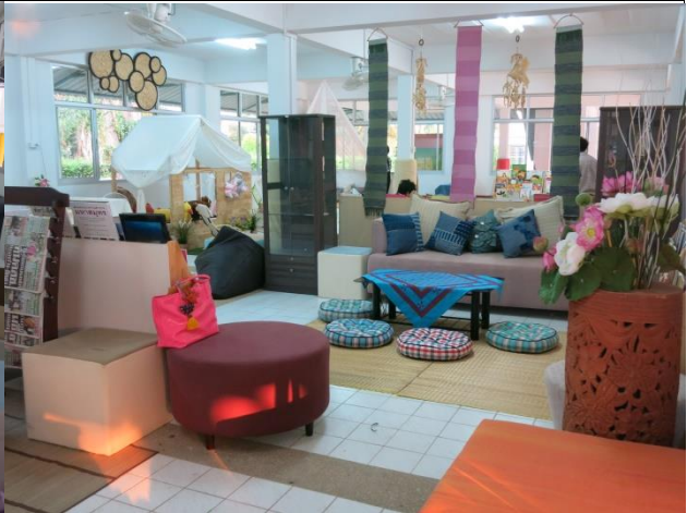
หลัง สร้างเป็นมุมพักผ่อน